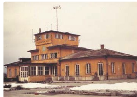
Bis 1969 fand der Flughafen Thalerhof mit einem recht bescheidenen Abfertigungsgebäude inklusive Verwaltung und Tower sein Auslangen.