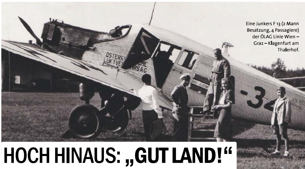
Eine Junkers F 13 (2 Mann Besatzung, 4 Passagiere) der ÖLAG Linie Wien – Graz – Klagenfurt am Thalerhof.