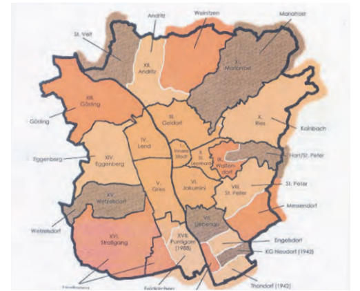
Ehem. Teile der heutigen Gemeinde. Die Stadterweiterung von 1938 und 1942 (Thondorf) und mit dem 1988 zum XVII. Bezirk erklärten Puntigam. 19 Gemeinden und Gemeindeteile kamen 1938 und 1942 zu Graz (Graphik: K. Kersten).