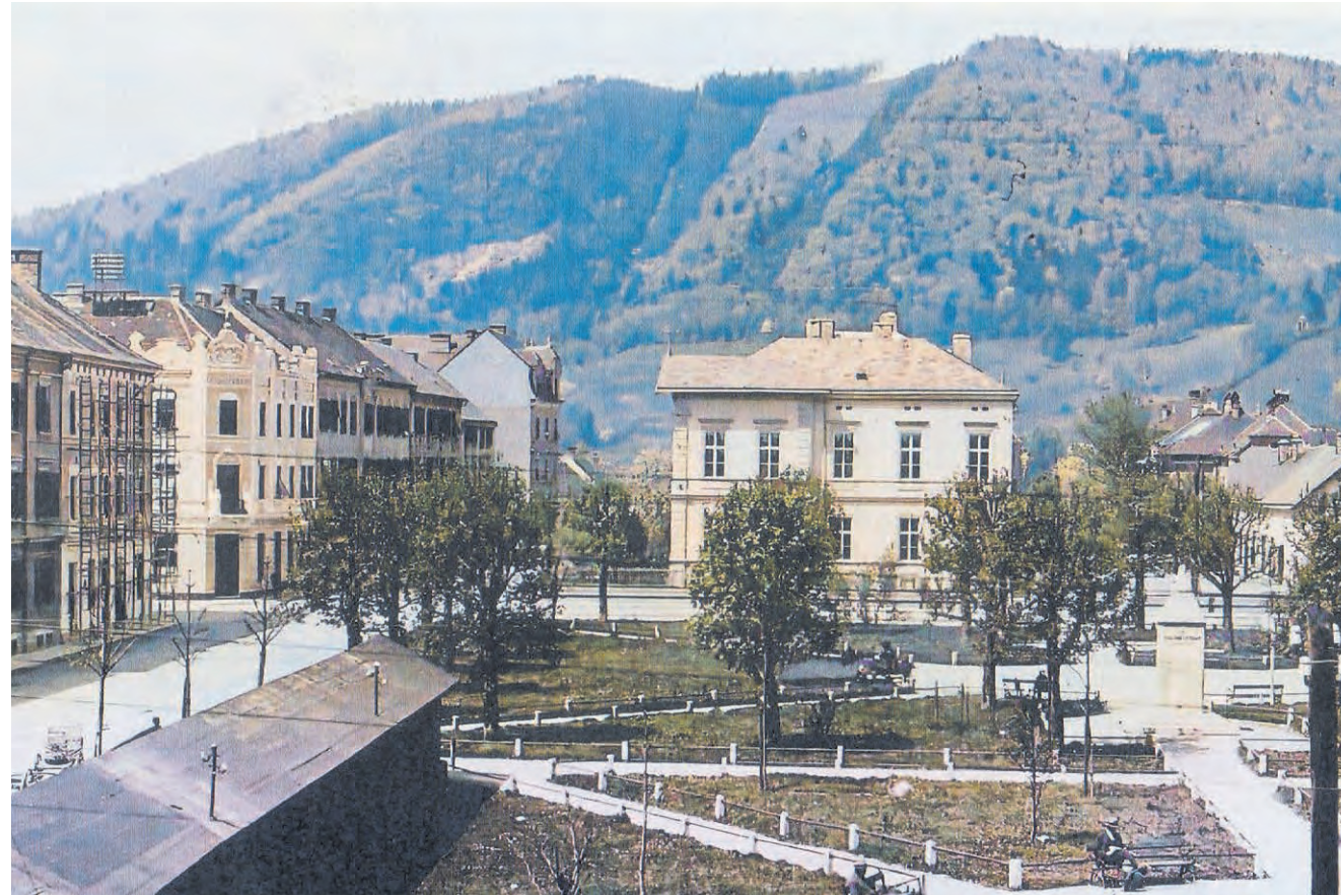
Eggenberg Rathauspark. Die Marktgemeinde Eggenberg hatte trotz der Abtrennung von Wetzelsdorf im Jahr 1914 bei ihrem Anschluss an Graz mehr als 20.000 Bewohner. Stolz werden hier das Rathaus (Bildmitte) und der Rathauspark präsentiert.