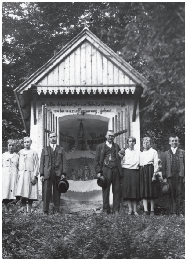
Abb. 2: Die Winterbauerkapelle in St. Radegund mit der Familie des Erbauers, um 1925

In St. Radegund begann man noch im Jahr 1916, die Maiandachten als sogenannte „Kriegsandacht“ zu halten. 10