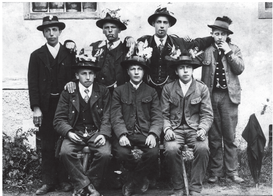
Abb. 1: Rekruten aus St. Radegund nach der Musterung, 1914

tief betroffen als die Nachricht von der Ermordung des Thronfolgers eintraf. Die erhalten gebliebenen Pfarr- und Schulchroniken der Region berichten ausführlich darüber, in jeder Pfarre zwischen Eggersdorf und Semriach wurden Trauergottesdienste für die beiden Ermordeten abgehalten. Es folgten drei Wochen zwischen Bangen und Hoffen, ob nun ein Krieg kommen werde oder nicht. Kriegsbegeisterung herrschte, anders als in den Städten und Märkten mit ihrer bürgerlichen, gutteils deutschnational gesinnten Bevölkerung, in den agrarisch dominierten Gemeinden des Schöcklgebietes demnach keine. Die Menschen waren zu realistisch, die Bauern wussten, dass eigentlich die Ernte bevorstand, und vielen Frauen und Müttern war sonnenklar, dass der Abmarsch der Männer in den Krieg ein Zug ins Ungewisse war. In Gutenberg an der Raabklamm kam es beim Abmarsch der Einrückenden zu herzerreißenden Szenen. Die Pfarrchronik berichtet von weinenden Kindern und Hände ringenden Frauen, die den Auszug begleiteten. 1