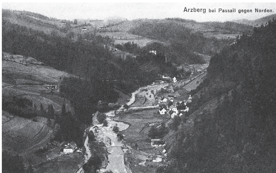
Abb. 5: Die Ortschaft Arzberg nach dem verheerenden Hochwasser des Jahres 1916. Deutlich erkennbar sind die überschwemmten Felder und der verwilderte Flusslauf der Raab.

Die Situation musste sich in diesen Monaten in der Region wirklich bereits dramatisch zugespitzt haben, denn zu Jahresbeginn 1918 berichtet auch die Pfarrchronik aus dem benachbarten St. Radegund: Die Teuerung aller Bedarfsartikel steigt unheimlich durch die Hamsterer und besonders aber durch die Schleichhändler werden die Preise maßlos emporgetrieben, nur die Höchstpreise für die Produkte der Bauern reichen nicht einmal an die Gesteungskosten heran; es müssen z. B die Landwirte ihr Getreide an die berüchtigten Zentralen um 50 K den Metzen verlieferen. 24