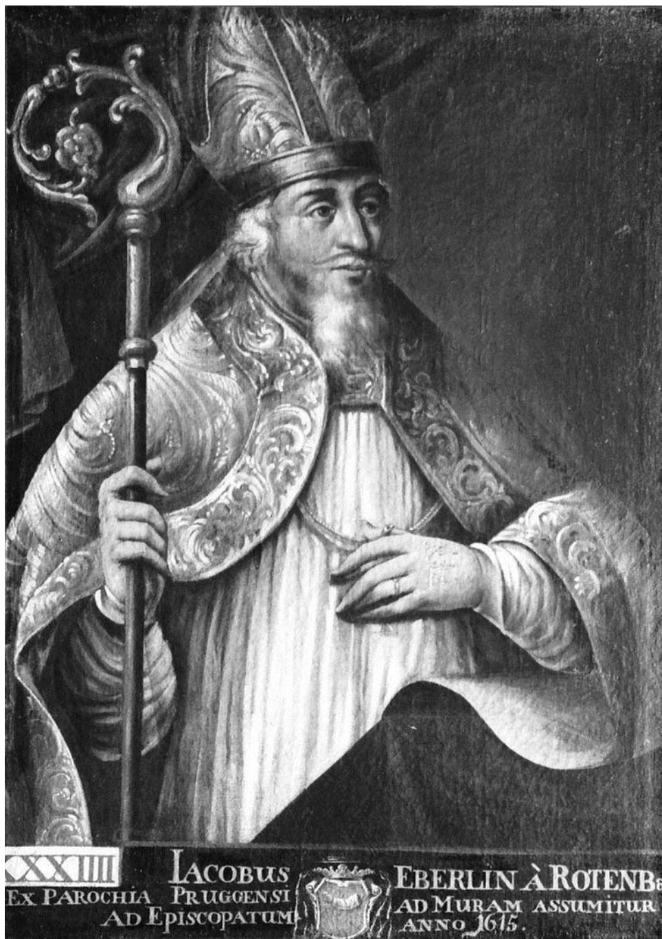
Abb. 1: Bischof Jakob Eberlein. Porträtmalerei im Fürstenzimmer von Schloss Seggau (Diözesanmuseum Graz)